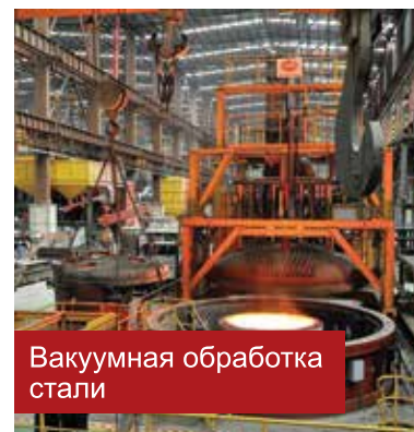
Вакуумная обработка стали